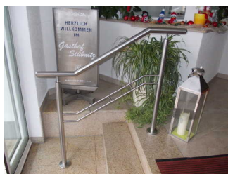
Treppe nach dem Haupteingang

Über die Treppe sind zu erreichen: Zugang zur Pension