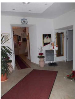
Weg zur Rezeption / Restauranttheke