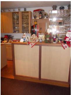
Restauranttresen und "Rezeption"