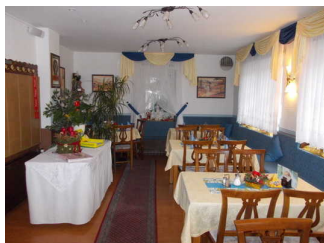
Gastraum des Restaurants