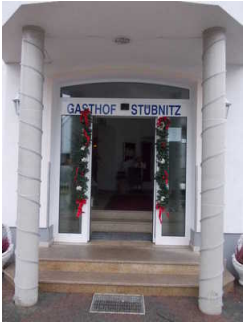
Haupteingang mit Stufen

Zugang zum Betrieb / zur Einrichtung über: Treppe nach der Haupteingangstür , Treppe vor der Haupteingangstür