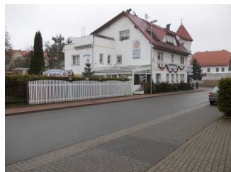
Weg zur Pension