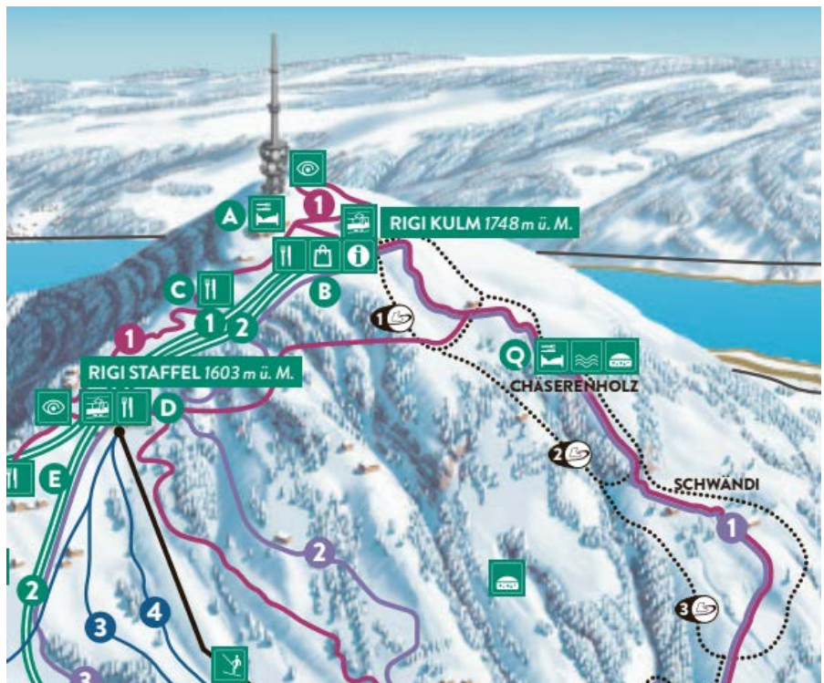
Kartenausschnitt von Rigi Kulm mit den drei Schneeschuhtrails (Nr. 1, Nr. 2 und Nr. 3)

Schneeschuhlaufen braucht keine speziellen technischen Vorkenntnisse und kann von jedermann, auch auf den präparierten Winterwanderwegen, praktiziert werden. Die Versicherung ist Sache der Teilnehmer/innen.