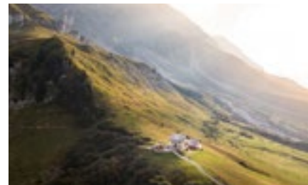
Schesaplana- hütte SAC

Als Ziel folgt die Bündner Herrschaft, welche einerseits durch Johanna Spyris Kindergeschichte «Heidi» und andererseits durch die ausgezeichneten Weine rund um den Globus bekannt sein dürfte.