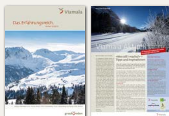
Die aktuelle Winterbrochure 2018/19

*Betrieb gemäss Betriebszeiten Bergbahnen